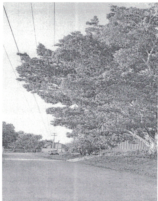
Rua Campo Verde, Setor 01